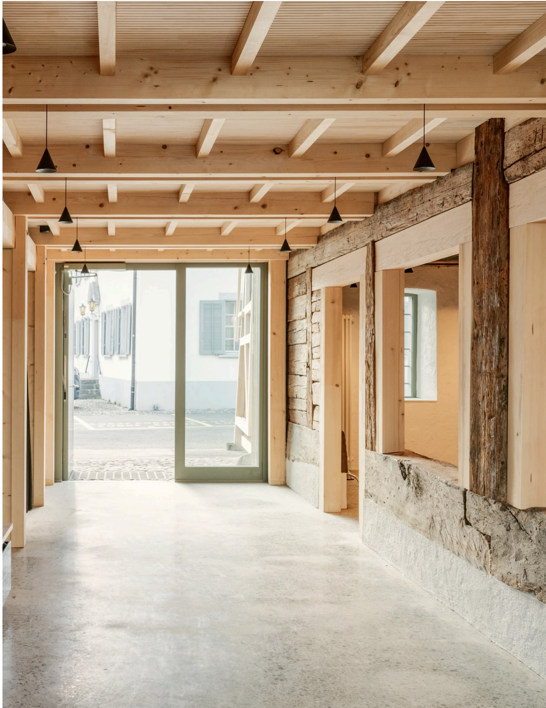
Durchbrüche in den Bohlenwänden verbinden Eingangsbereich und Bar.

Gegenüber der Bar führen eine Holzterrasse und ein verspiegelter Lift nach oben. Die Architekt*innen nutzten die schmale, bis unters Dach reichende Tenne geschickt, um die neue Vertikalerschliessung schonend zu integrieren. Überhaupt zeugt der Umbau der Zehntenscheune von Umsicht für das Baudenkmal. Sorgfältig detaillierte Holzbauarbeit, eine fein abgestimmte Materialpalette sowie Fenster, Türen und Geländer in gedecktem Grün bringen den Bestand zur Geltung und schaffen eine festliche Atmosphäre.